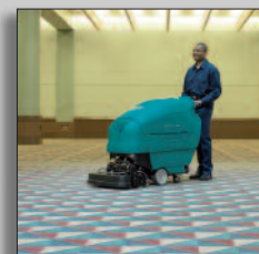
Machine en action