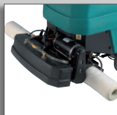
Les rouleaux de la 1610 pour nettoyage d'entretien