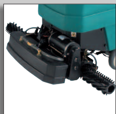
Les brosses de la 1610 pour nettoyage-rénovation